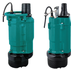
ปั๊มจุ่ม