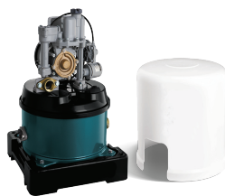
ปั๊มอัตโนมัติ