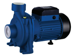
ปั๊มทอยโซ่ง