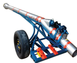
ปั๊มพญานาค